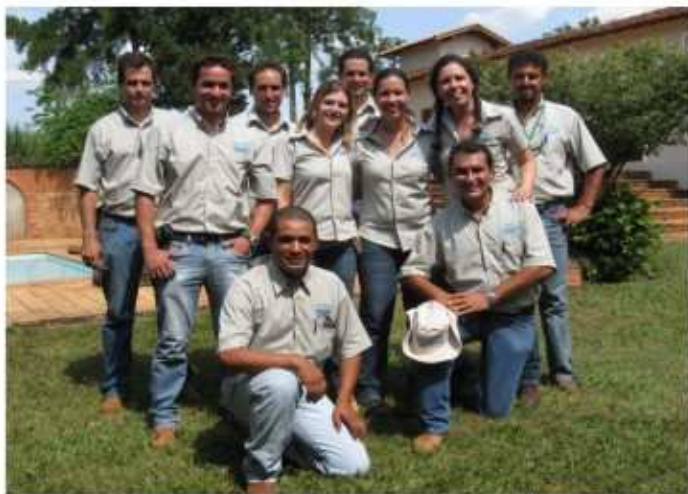
Equipe CanaVialis - jovens profissionais altamente qualificados e dedicados ao setor.

Após 6 anos de existência, a CanaVialis se orgulha de em tão pouco tempo ter um pilar de sucesso almejado por grandes empresas : ter pessoas que fazem a diferença.